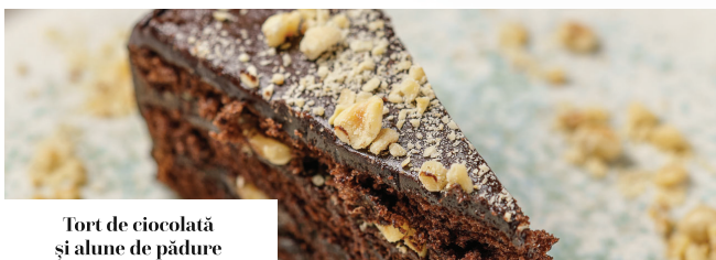
Tort de ciocolată și alune de pădure