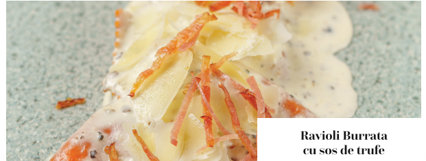
Ravioli Burrata cu sos de trufe