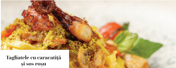
Tagliatele cu caracatiță și sos roșu