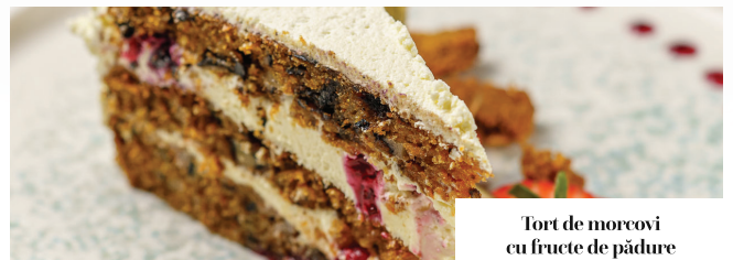
Tort de morcovi cu fructe de pădure