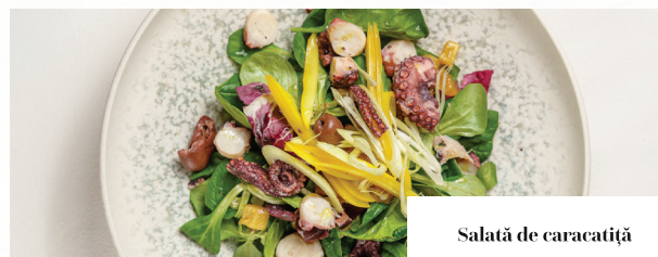
Salată de caracatiță