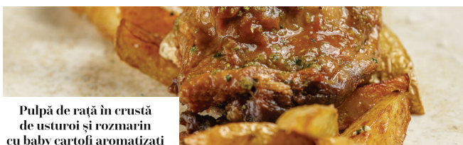
Pulpă de rață în crustă de usturoi și rozmarin cu baby cartofi aromatizați

Valori nutritionale / 100g Valoare energetica: 127.84 KCal / 534.88 KJ, Grasimi: 7.74 g, Acizi grasi saturati: 0.55 g, Glucide: 3.37 g, Zaharuri: 0.5 g, Proteine: 11.53 g, Sare: 1.07 g Crustacee, Peste, Moluste, Mustar, Oua, Gluten