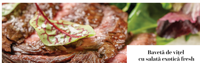
Bavetă de vițel cu salată exotică fresh