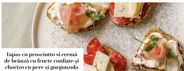
Tapas cu prosciutto și cremă de brânză cu fructe confiate și chorizo cu pere și gorgonzola

Valori nutritionale / 100g Valoare energetica: 304.8 KCal /1275.27 KJ, Grasimi: 21.15 g, Acizi grasi saturati: 5.58 g, Glucide: 12.45 g, Zaharuri: 1.46 g, Proteine: 16.99 g, Sare: 0.56 g Lapte, Fructe cu coajă lemnoasă